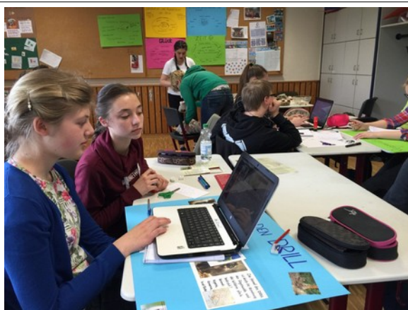
Recherchen über den Drill

Dementsprechend nahmen wir die Einladung der Gesamtschule Harsewinkel gerne an, im Rahmen der Bewerbung der Schule, als UNESCO-Schule zertifiziert zu werden, sowohl LehrerInnen als auch SchülerInnen der Sekundarstufe I über Artenschutz und den Drill zu informieren. Im Mai dieses Jahres boten wir daher zum ersten Mal Workshops für LehrerInnen und