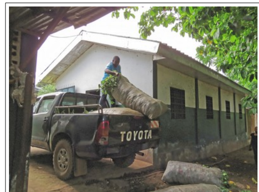
Abladen der Futterpflanzen im LWC

Die Pflanzen werden 3 mal in der Woche geerntet, dann wird der dafür zuständige Fahrer im LWC angerufen und er macht sich auf den Weg. Unterwegs wird er von einigen Arbeitern erwartet und diese führen ihn dann zu den Plätzen, wo die geernteten Pflanzen an der Straße lagern. Insgesamt waren wir 2 Stunden unterwegs und haben in einem Umkreis von etwa 25 km an die 500 kg Futterpflanzen eingesammelt und ins LWC gefahren. Dort wurde alles gewogen und mit Peggy dann der Kilopreis abgerechnet. Dieses Geld wird dann von dem Leiter des Projektes, Daniel Akala, den ich auch bereits bei meinem letzten Besuch in Kamerun kennengelernt habe, entgegengenommen und an die einzelnen Mitarbeiter in den umliegenden Orten verteilt.