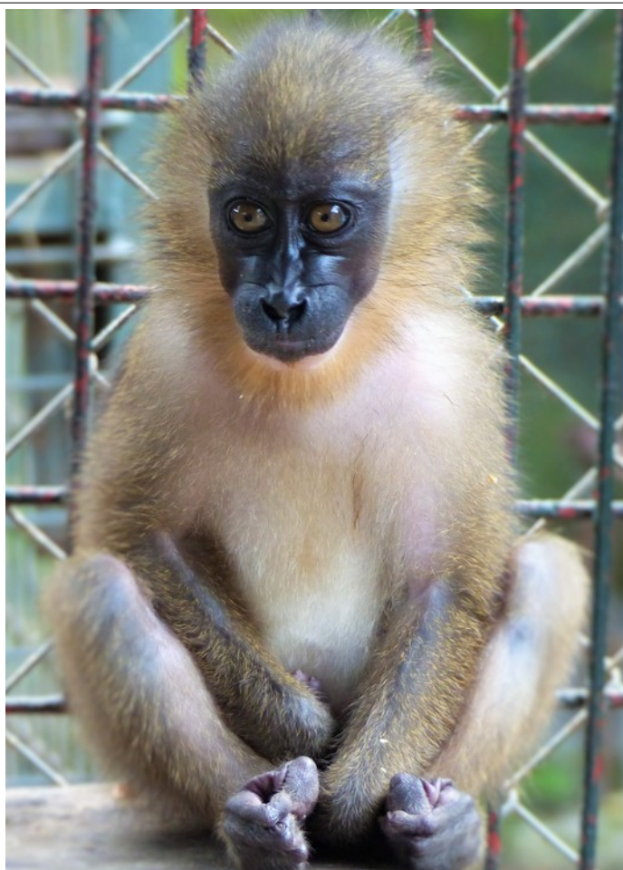
Junges Drillweibchen im LWC

In diesem Frühling habe ich, nun bereits zum dritten Mal, das Limbe Wildlife Center (LWC) in Kamerun besucht.