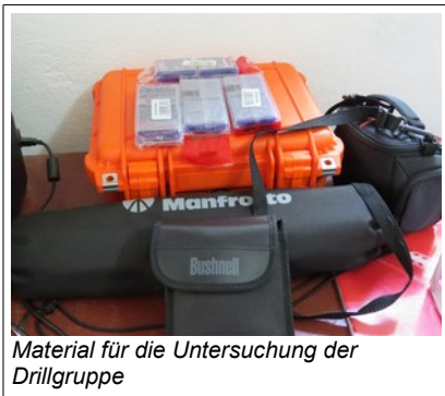
Material für die Untersuchung der Drillgruppe

Es geht dabei darum, die Drills im LWC erstmalig ethologisch zu untersuchen. Es sind 86 Tiere, die in einer großen Gruppe zusammenleben. Davon sind 11 voll ausgewachsene Männchen. In solch einer Gruppe, zumal in den doch recht beengten Verhältnissen dort, kommt es immer wieder zu Stress und kleineren oder größeren Verletzungen durch Beißereien. Um diese Gruppe besser kennenzulernen und auch zu strukturieren, vielleicht sogar ggf. in Untergruppen aufzuteilen, muss