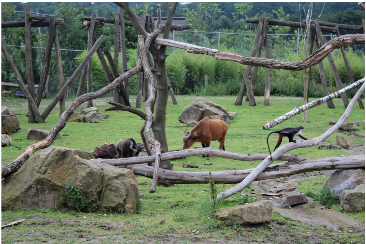
Erfolgreich vergesellschaftet: Drills, Rotbüffel und Diana-Meerkatzen im Zoo Osnabrück

Diana-Meerkatzen-Männchen „Kindi“ (geb. 04. Sep. 2000 in Twycross) verstarb leider drei Monate nach seiner Ankunft aus dem Zoo Warschau aufgrund eines akuten Herz-Kreislauf-Versagens.